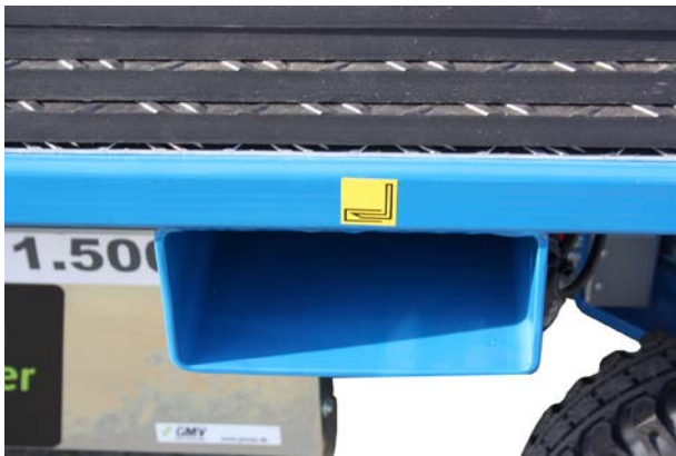
Schuh für die Gabelstapler-Verladung