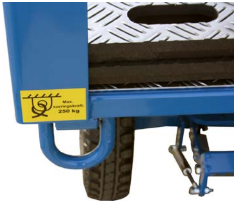
Öse für die Ladungssicherung