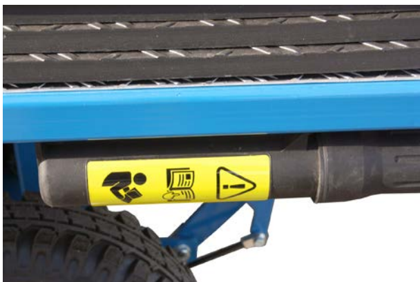
Halterung für die Bedienungsanleitung